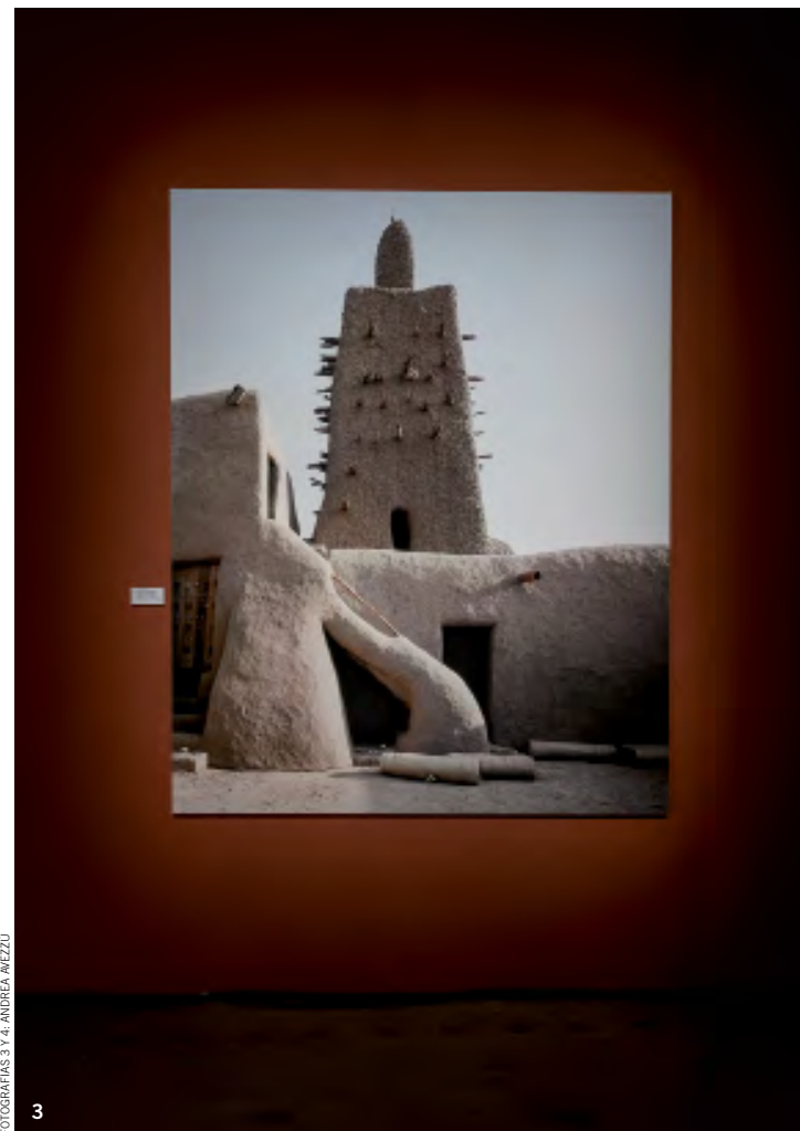
FOTOGRAFÍAS 3 Y 4. ANDREA AIEZZO