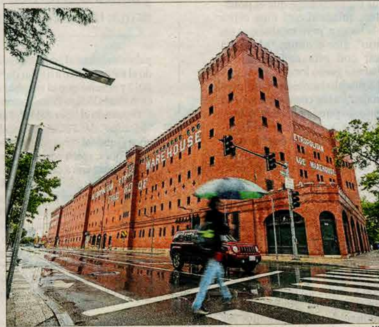
Edificio del MIT, cuya reforma estudiaron Flores &amp; Prats

Aquella cálida acogida propició un goteo de encargos internacionales, unos arquitectónicos, otros docentes, que Flores & Prats fue-