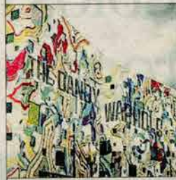
The Dandy Warhols

Y ante este cúmulo de adversidades renace una Ariana Grande dispuesta a superar y sobreponerse ante tal cúmulo de desgracias y adversidades. Letras que muestran que las estrellas son de carne y hueso, que ante los contratiempos hay que reaccionar con determinación, idea clara y espontaneidad. Mensajes captados y convenientemente trufados y argamasados por, entre otros, esas máquinas poperas que son Max Martin y Tommy Brown, pero que confeccionan obra de muy frágil entidad musical. Para remarcar el tono de que se trata de un álbum de una cantante humana que aspira a que se la valore sólo por ese hecho, aquí brillan por su ausencia duetos refulgentes o llamativos invitados. Más de uno/a habrá pensado: ¡qué lástima!