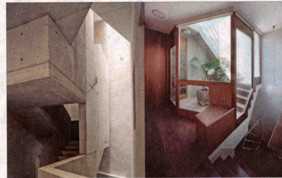
En el tercer piso de Flores, la escalera, rodeada por un espacio de luz que permite, al ir, que se vea el espacio de la planta superior. Al lado de la planta superior, un espacio de luz que permite, al ir, que se vea el espacio de la planta superior. Al lado de la planta superior, un espacio de luz que permite, al ir, que se vea el espacio de la planta superior.

Thought by Hand documents the work of Flores & Prats, an architecture studio founded in 1997 by Ricardo Flores and Eva Prats, that combines working on projects and constructions with a busy academic schedule at various universities. The book reflects the essence of its authors by displaying their design processes that range from sketches and drawings to detailed models of each one of their projects. It compiles works including renovations, social housing, public spaces, neighborhood participation, and university workshops. Texts written by Miquel Adrià, Eva Prats, Ricardo Flores, Juan José Lahuerta, Adrià Goula, Joan Enric Prats, Cesc Segura, Manuel de Solá-Morales, Manuel Arguijo, Carlota Coloma, Adrià Lahuerta, Soraya Smithson, Miralda and Toni Casares.