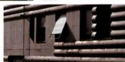
Emplazamiento y sección longitudinal, vista frontal, escaleras, planta y detalle de ondas, balcones y persianas del edificio de viviendas en Terrassa