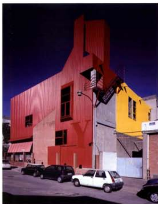
Visión de la esquina y axonométrica de la rehabilitación y ampliación de la nave YUTE'S en Barcelona

El proyecto es un comentario a los tres edificios existentes. Desde un punto de vista formal, puede ser visto como una serie de bandas longitudinales dentro del movimiento lineal del camino de entrada, que mantienen juntos los lados opuestos.