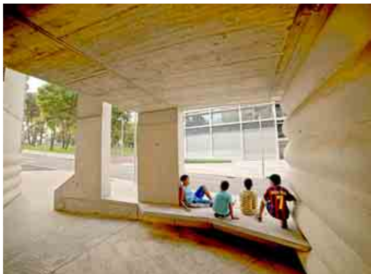
Izq.: vista exterior del Edificio 111 de Terrassa y detalle de un espacio interior. Dcha.: imagen aérea del Centre Cultural Casal Balaguer en Palma de Mallorca en la que se puede ver la intervención arquitectónica de Flores & Prats.