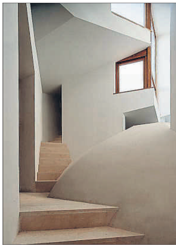
El casal Balaguer, a Palma

s'instal·larà el museu, les estances conserven tot el llustre històric –començant pel vestíbul de recepció–, gràcies a unes dimensions molt folgades, a les boniques fusteries restaurades i al renovat paviment de pedra de Santanyí. També en aquestes sales s'aprecien petites intervencions que permeten entrades de llum o generen visuals. Però és sobretot a la planta superior on això últim és més patent. Sovint els casals són foscos, i els arquitectes han lluitat contra això convidant la llum una vegada i una altra a entrar-hi. Una llum que llisca per les parets, que taca els terres i crea una atmosfera màgica.