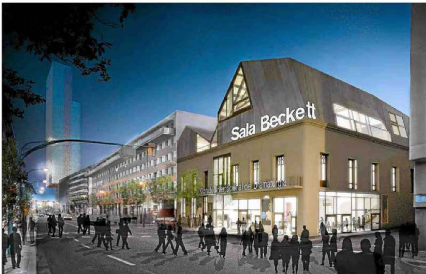
Imagen virtual de la fachada de la nueva sede de la Sala Beckett en Poblenou.