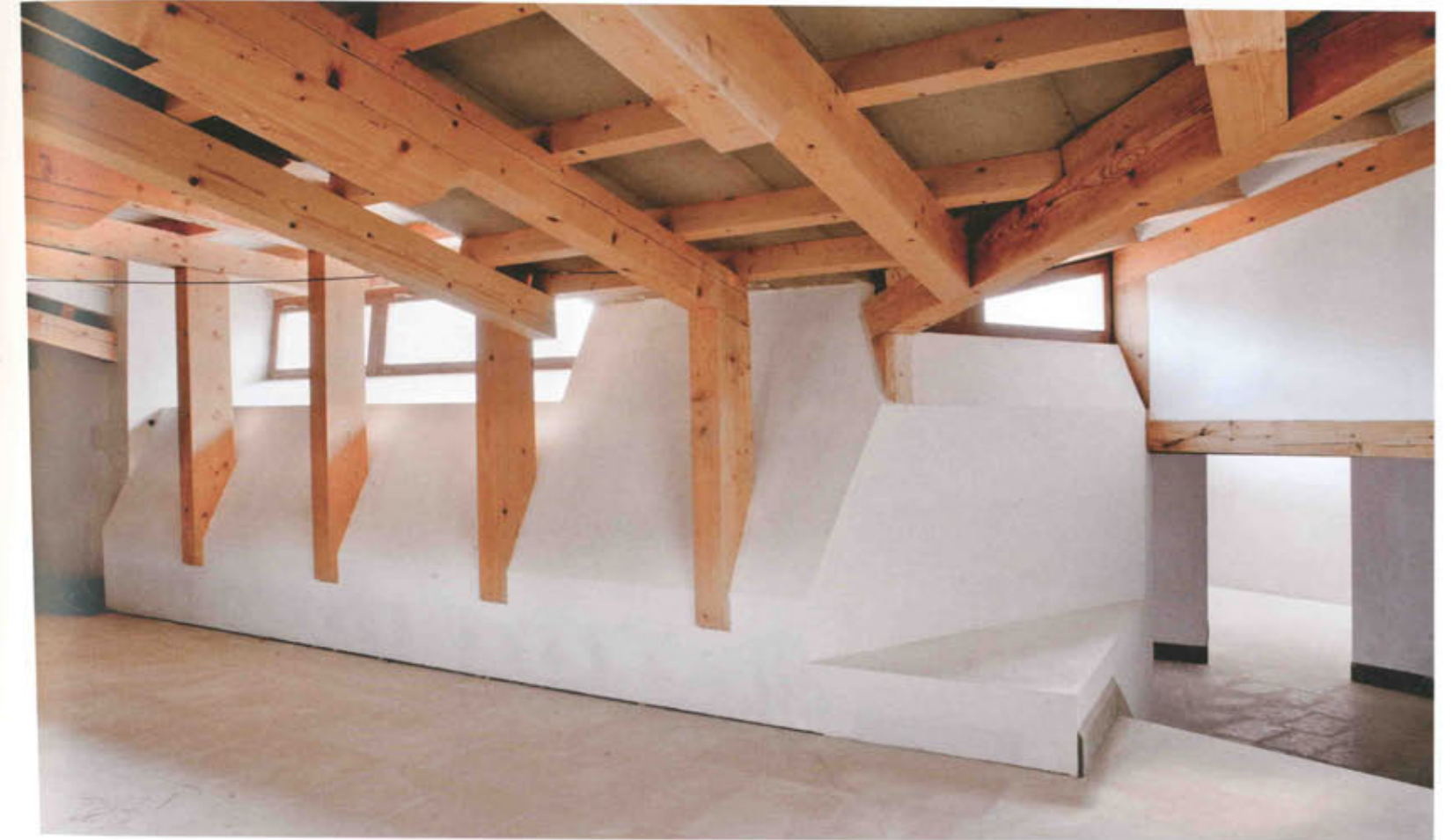
Centro Cultural Casal Balaguer / Casal Balaguer Cultural Centre